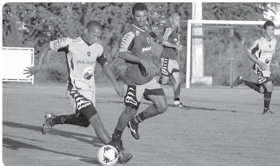
Equipe continua treinando no campo da Oceania. No sábado joga amistoso no Almeidão