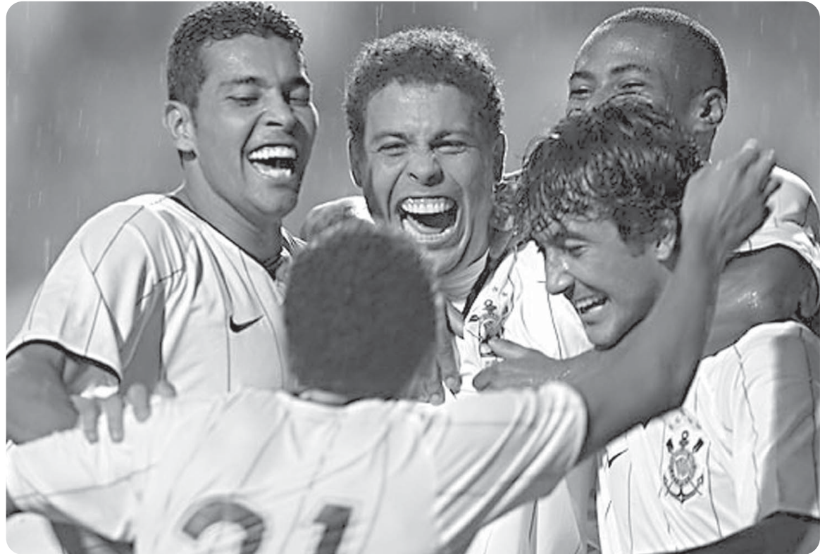
Ronaldo é abraçado pelos companheiros após marcar o gol da vitória, quarta-feira, diante do São Caetano

Apesar da satisfação pelo sucesso do antigo comandado, Luxemburgo já se mostra desconfortável ao abordar constantemente a volta dele aos campos. "Quero esquecer o Ronaldo, deixar ele para lá", disse o técnico, em certo momento da entrevista após o empate contra o Ituano, no Estádio Novelli Júnior.