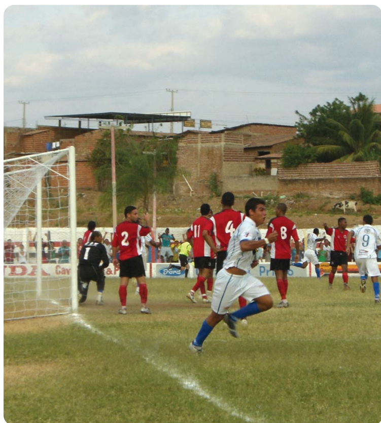
Cruzeiro e Santa Cruz confirmaram inscrição na Segunda Divisão de 2009

"Isto não quer dizer que todas as onze equipes participem da Segunda Divisão. Acreditamos que, somente