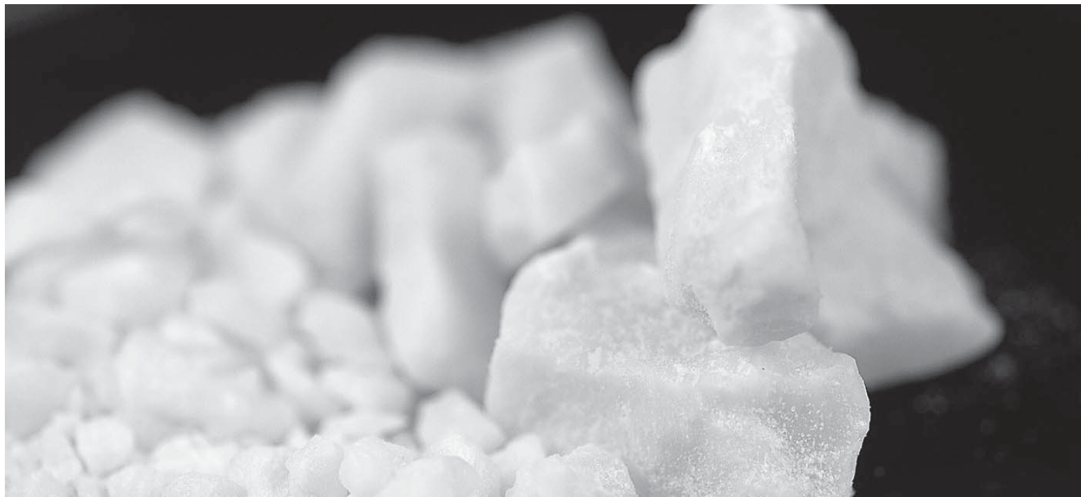
Subproduto da cocaína, o crack é uma droga mais barata e isto facilita a venda junto aos jovens das periferias das grandes e médias cidades brasileiras