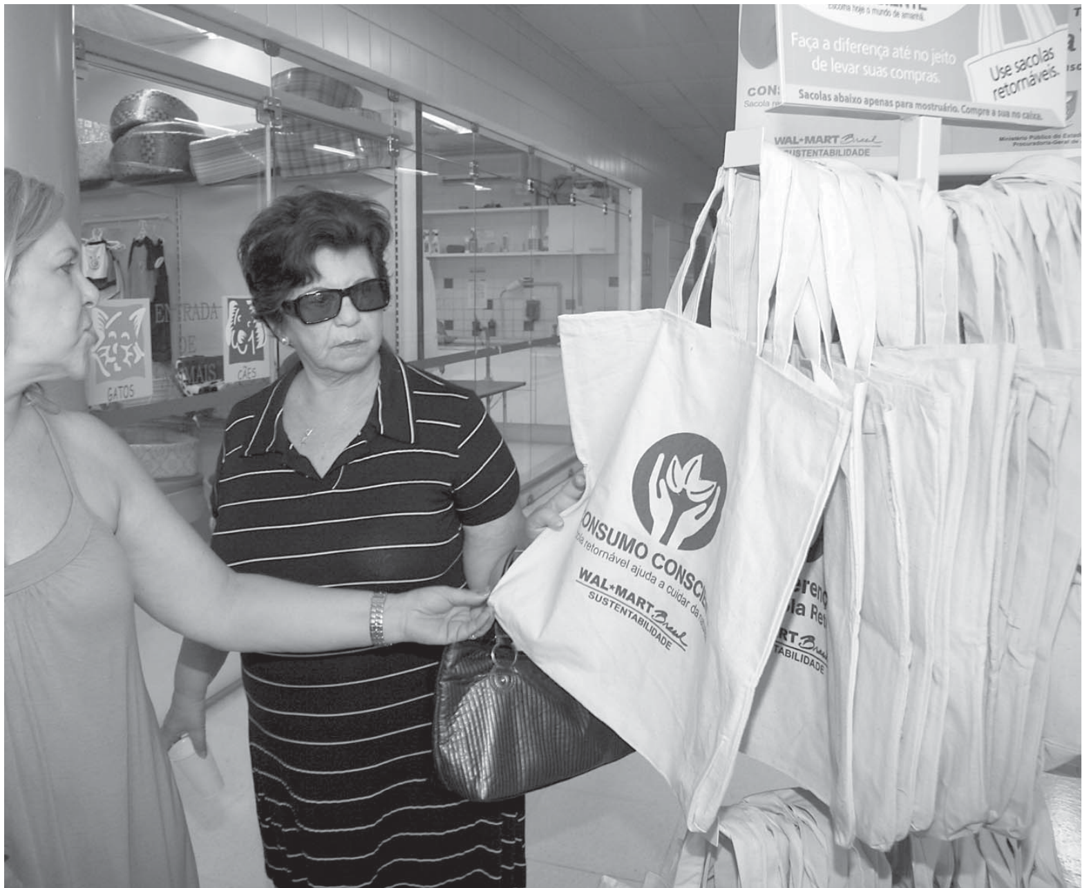
As sacolas retornáveis, que já estão à venda no comércio pessoense, começam a conquistar a preferência dos consumidores durante as compras

Esses sacos jogados no lixo provocam grandes lesões ambientais”, disse ele revelando que a China já proibiu o uso de sacolas plásticas e que vários países da Europa também estão eliminando ou cobrando pela sacola plástica.