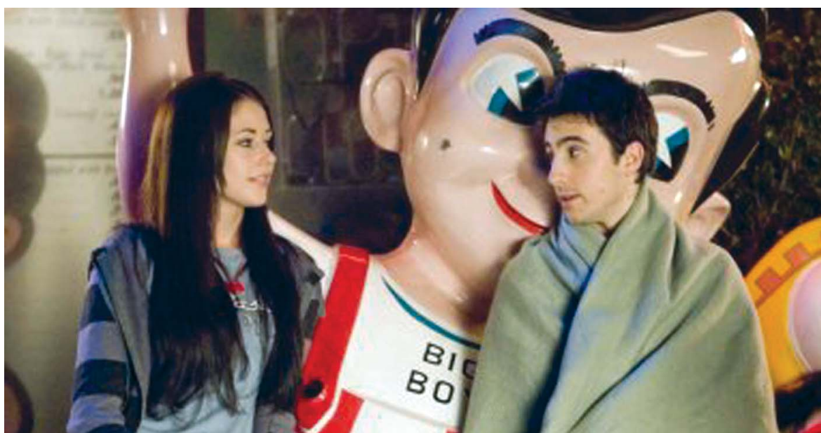
"Sex Drive - Rumo ao Sexo" é o besteiro americano