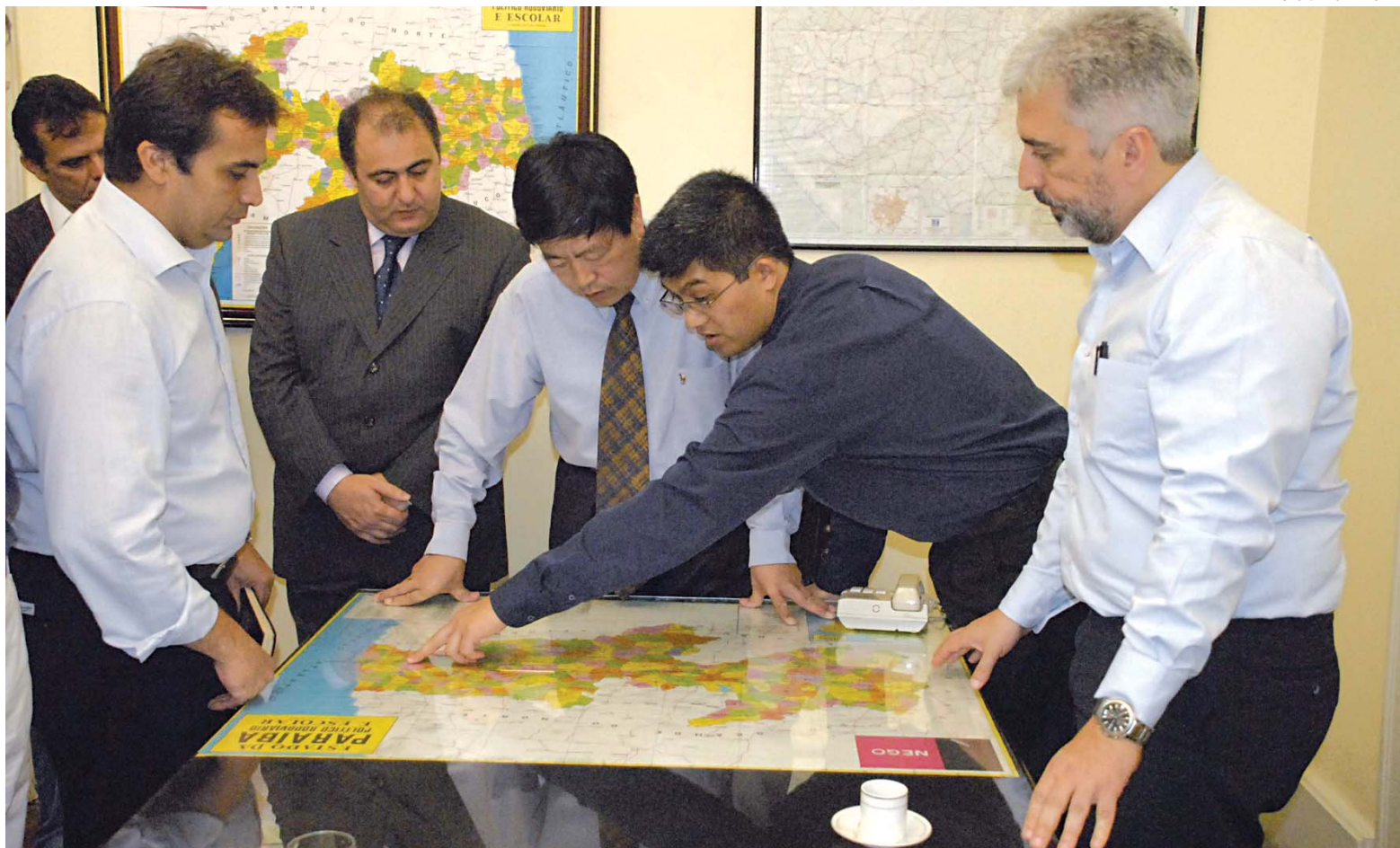
Os empreendimentos do grupo serão executados no prazo de dois anos, e somente com o resort vão ser gerados 800 empregos, sendo 300 diretos

Os três outros empresários são das áreas de hotelaria, cassinos e um da área médica. O empresário tiveram audiência com o Governo do Estado na companhia do cônsul honorário do Uruguai, Herbert Tort.